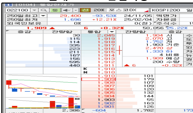
현재 : KRX 단일시장